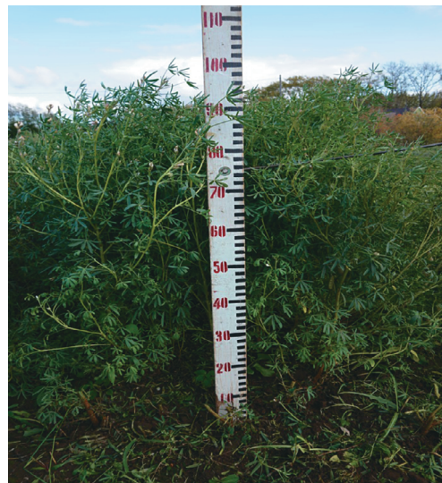
Рис. 2. Сорт Сидерат 46 в фазу укосной спелости, 2019 г.

По урожайности зерна во все годы испытаний выделился скороспелый сорт Ладный – 2,00 т/га (табл. 3). Урожайность семян в 2019 г. получена лишь у этого сорта, остальные сорта в условиях 2019 г. не вызрели. Вегетационный период по годам исследований у сорта Ладный составил 89 сут. в 2017–2018 гг. и 110 сут. в 2019 г. Наивысшей массой 1000 семян характеризовались сорта Фазан, Дикаф и Ладный (129,4–131,4 г). Устойчивость к полеганию у всех сортов люпина согласно международному классификатору отмечена как высокая, составив 9 баллов.