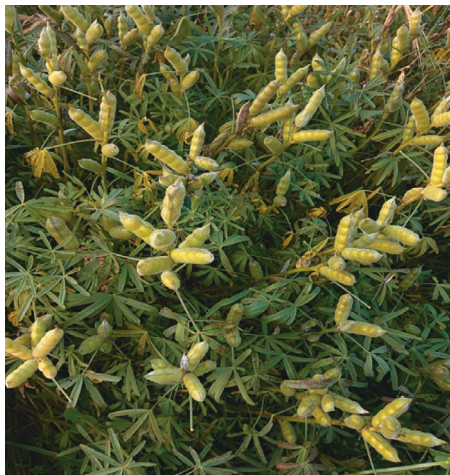
Рис. 3. Сорт Ладный в фазу созревания бобов

Оценка экономической эффективности выявила высокий уровень рентабельности возделывания люпина узколистного на семена в субарктической зоне Российской Федерации (табл. 4).