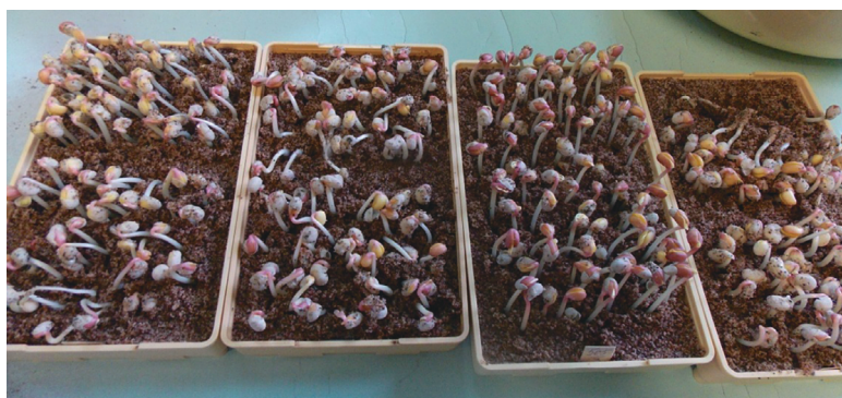
Рис. 4. Определение послеуборочной всхожести люпина узколистного сорта Ладный, урожай 2018 г.