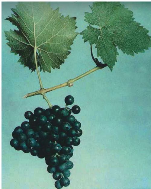
Рис. 2. Сорт винограда Фиолетовый ранний

Дегустационная оценка свежего винограда составила 7,7 балла. Десертные вина отличаются оригинальностью букета: ярко выраженным ароматом чайной розы, имеют мягкий гармоничный вкус. Дегустационная оценка составляет 8,5 балла.