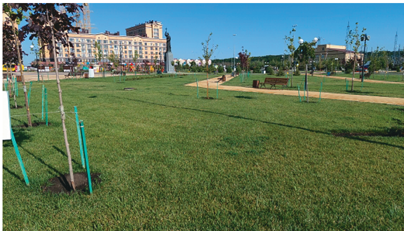
Рис. 4. Газон сквера на Владимирской площади

serriola L., Vicia angustifolia L.; единичны – Lotus corniculatus , Erigeron canadensis , Daucus carota L., Sonchus oleraceus L., Lathyrus tuberosus L. Trifolium pratense (обилие – г-1) (Мониторинг 2021 г.) (рис. 4).