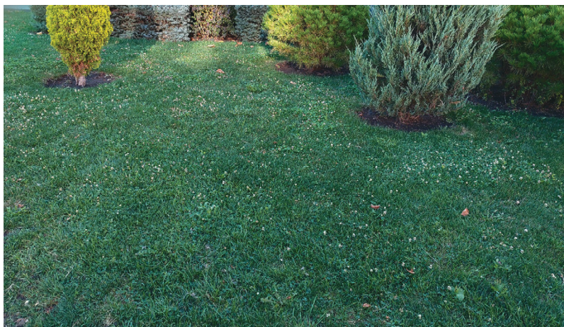
Рис. 5. Газон сквера на Александровской площади

В сквере установлена стационарная система орошения. Антропогенные повреждения и поражения болезнями травостоя газонов не отмечены. Работы по уходу регулярные. Травостой газонов имеет удовлетворительное качество (Мониторинг 2018, 2021 гг.) (рис. 5).