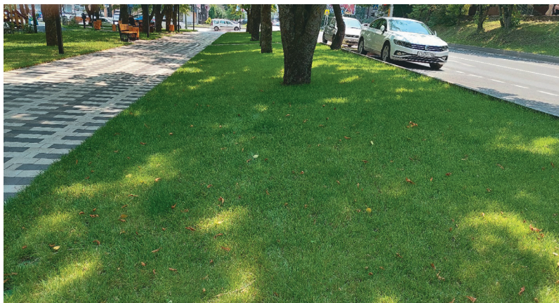
Рис. 1. Газон сквера Декабристов

изредился, проективное покрытие составляет 20–30% (в условиях сильного затенения относительное световое довольствие 12 июля 2021 г. в 13 час. – 2,2%). Затененные участки газонов в сквере дворца им. Гагарина также постепенно изреживаются, их проективное покрытие составляет 40–60%, ОСД 12 июля в 13 час. – 3,0–3,5%. Сорные виды в травостое газона практически отсутствуют, антропогенные повреждения и поражение болезнями не отмечены. Установлена стационарная система полива, стрижка регулярная, сорные виды единичны (Мониторинг 2021 г.).