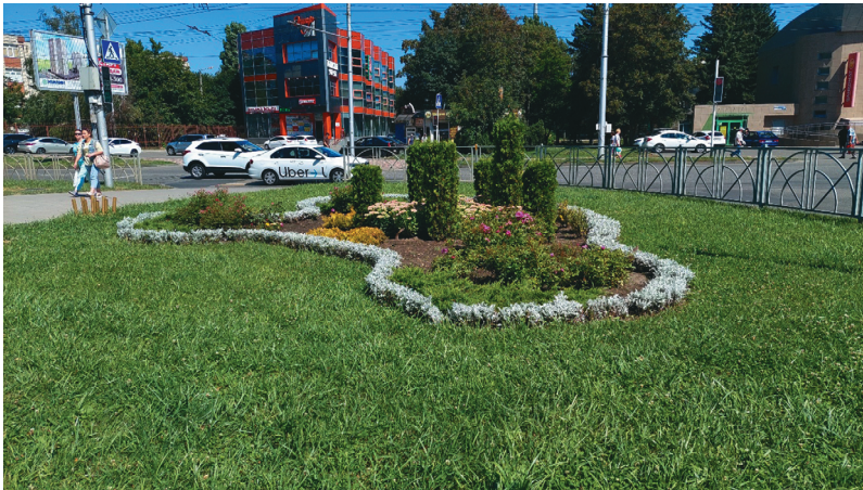
Рис. 3. Газон сквера на проспекте Юности

В сквере на проспекте Юности газонами оформлены все декоративные объекты: центральная клумба, аллея кленов шаровидных, клумбы и рабатки; территория, прилегающая к жилой застройке. Двухлетний газонный травостой состоит из смеси райграса пастбищного и овсяницы тростниковой с неравномерными подсевами клевера ползучего. Травостой имеет плотность 5,0–6,2 тыс. побегов на 1 м 2 , ширина листовых пластинок – 2,0–3,0 мм и 0,6–1,2 см, листорасположение вертикальное. После скашивания травостой неравномерный по высоте – 5–8,5 см (овсяница тростниковая обладает большей отавностью и опережает по размеру райграс пастбищный), цвет – ярко-зеленый. Соответствует показателю «Травостой удовлетворительного качества» (рис. 3).