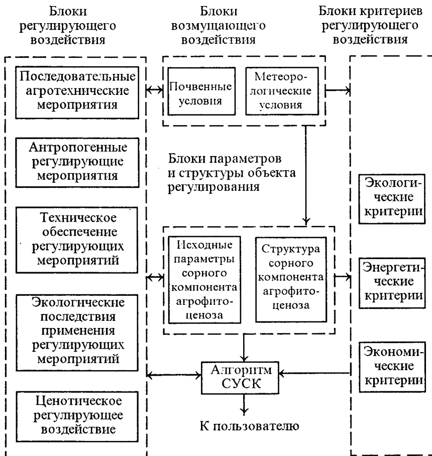
Рис. 2. Блочная структура модели СУСК.

бицидов видов сорняков, определяются уровень их аллелопатической активности и реакция на отдельные виды удобрений с учетом норм их внесения. На этом этапе уточняются конкурентоспособность культурных растений по отношению к отдельным ценопопуляциям сорняков, а также динамика прорастания семян и органов вегетативного размножения отдельных видов сорняков в зависи-