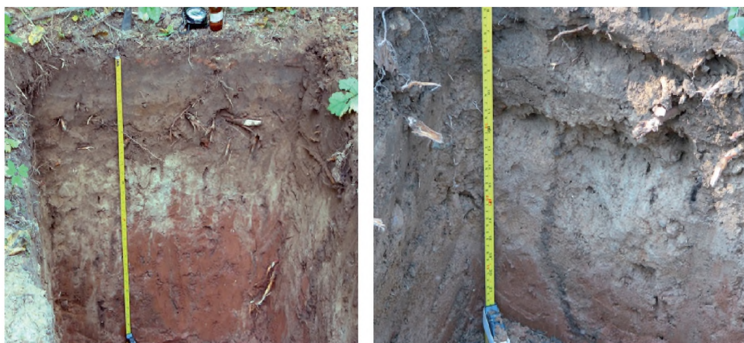
Рис. 4. Профиль дерново-подзола на двухчленах ЛОД РГАУ - МСХА имени К.А. Тимирязева (ранняя весна 2007 г.). Отчётливо видны миграционные «тяги», по которым отмечен «сброс» избытка влаги и мигрантов

Петрозаводска от 11 до 14 (см. рис. 2). Здесь отмечена трансформация иллювиально-железистого барьера миграции при сезонном поверхностном переувлажнении подзолов в микрозападинах [см. рис. 2]. Начальный этап вуализации (или эффект «гумусовой занавески» горизонтов E, V f мигрантами отмечен ранней весной. Генезис двух