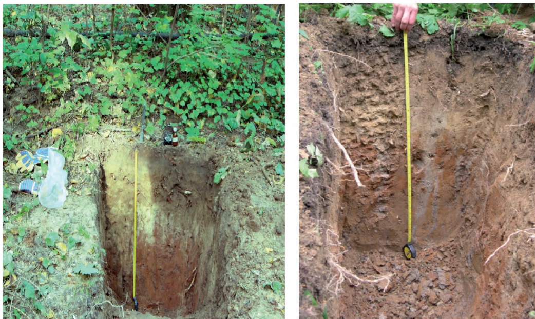
Рис. 3. Профили дерново-подзола на двухчленах: слева — в мае, справа — в августе. Плакор холма ЛОД РГАУ - МСХА имени К.А. Тимирязева