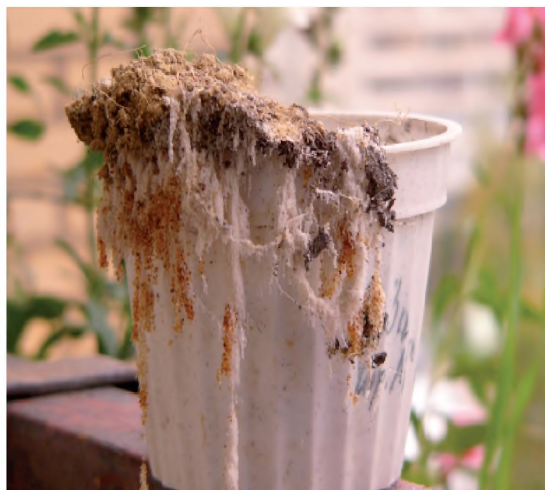
Рис. 5. Справа — сорбционный лизиметр, извлечённый из дерново-подзола на двучленах. Бурные частички — гранулы катионита КУ-2 в Н + форме, белесые — частицы кварцевого песка, которые плотно опутаны гифами плесневых грибов-кислотообразователей; слева — профиль дерново-подзола в мае. Отчётливо видна фронтально-линзовая водная миграция ВОВ в супесчаных слоях А 1 , Е и В г ; ВОВ способствуют диффузионной сегрегации конкреций Fe, Mn (2008) 1

гумификации растительного опада в новые органические вещества характеризуется формированием ионно-молекулярных форм ВОВ, экологически выгодных таёжной биоте. Процессы конденсации и полимеризации молекул ВОВ в сложные структуры сильно заторможены вследствие дефицита ионов Ca 2+ , азота и избытка ионов водорода. Данные процессы завершаются стадией образования химически активных водорастворимых фульвокислот (ФК) с ярко выраженными кислотными, аллелопатическими и комплексообразующими свойствами. Молекулы ФК представляют собой устойчивые к биодegradации компоненты ВОВ [21, 22]. В их составе всегда идентифицируются комплексные Fe-органические соединения. ВОВ, таким образом, выступают важным связующим звеном между процессами фотосинтеза и гумусообразования в таёжной экосистеме. Становится более понятной картина начального этапа таёжного гумусообразования и формирование гумусового профиля подзолов: в составе компонентов ВОВ, выщелачиваемых атмосферными осадками из лесных подстилок, уже содержатся «готовые» молекулы фульвокислот 1 как образцы структур новых мобильных органических веществ (это важно для авто каталитических реакций). Функции высокомолекулярных ГВ в таёжных экосистемах выполняют биополимеры растительного опада и лесной подстилки — лигнин, клетчатка, гемицеллюлозы и др. В хорошо аэрируемых песчаных подзолах европейского Севера моле-