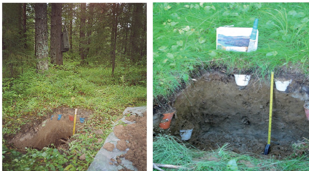
Рис. 1. Слева — профиль глееподзолистой почвы северной тайги; справа — установка сорбционных лизиметров в профиле подзола на двучленах в нижней 1/3 склона лесопарка Петрозаводска; гор. EL'g имеет голубой цвет за счёт аккумуляции in situ вивианита