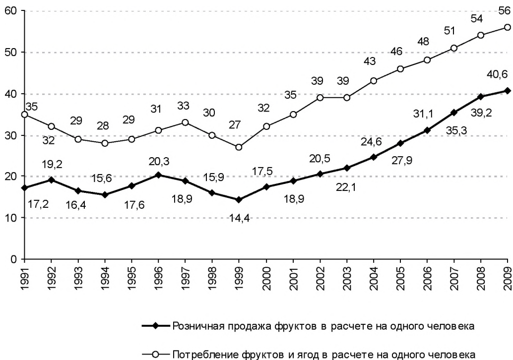
Рис. 2. Потребление фруктов и ягод и розничная продажа фруктов в расчете на одного человека в Российской Федерации по годам, кг

Ситуация в регионах свидетельствует о том, что есть субъекты Российской Федерации, где потребление фруктов и ягод в расчете на душу населения существенно выше, чем в среднем по стране и конкретному федеральному округу (табл. 2). Например, в Центральном ФО в 2009 г. максимумы потребления фруктов и ягод были характерны для Воронежской, Липецкой обл. и г. Москвы — 69, 68 и 66 кг на одного человека соответственно. В то же время минимум был зафиксирован в Костромской (38 кг) и Брянской обл. (41 кг). Это почти в 1,5 раза ниже, чем в среднем по России.