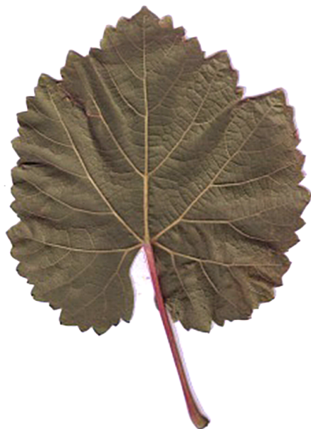
Рис. 2. Лист сорта винограда Красностоп Карпи (исходное изображение)