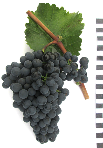
Рис. 1. Ампелографический снимок грозди сорта Красностоп Карпи

Ампелоснимок сорта Красностоп Карпи представлен на рисунке 1.