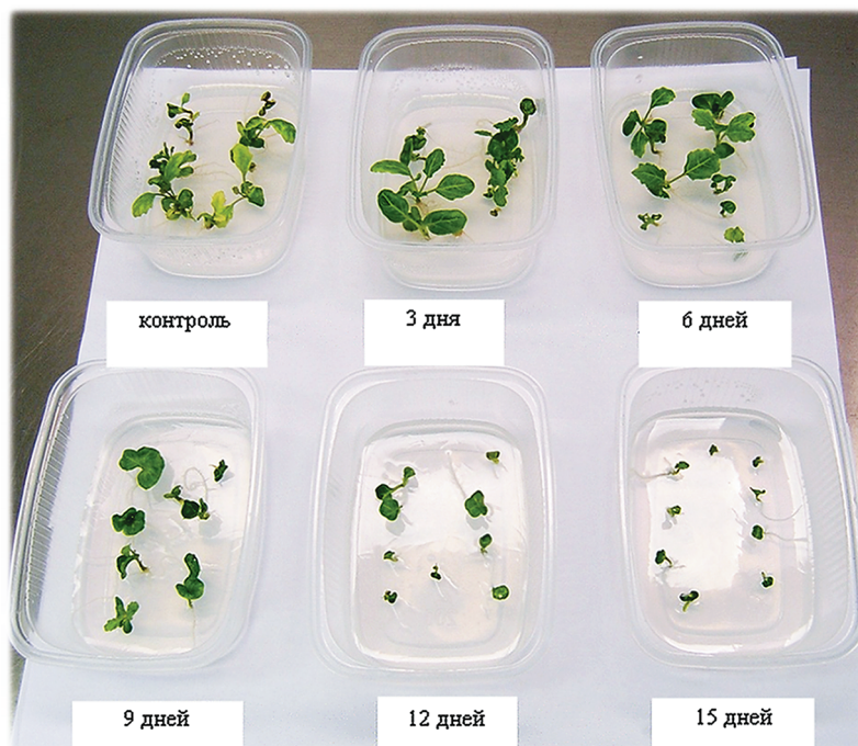
Рис. 3. Регенерация проростков из эмбрионов после холодной обработки при 5°C генотипа (Кор17×Кор2фКи)2–1 на 3-й неделе культивации

между частотой прямого прорастания эмбрионов при холодной обработке сроком 3–9 дней не наблюдались. Более длительная культивация при 5°C в темноте сроком 12 и 15 дней привела к уменьшению частоты прямого прорастания эмбрионов, среднего числа растений-регенерантов из прямо проросших эмбрионов и сдвинула сроки пересадки растений в грунт на 15 дней по сравнению с холодной обработкой без света в течение 3–9 дней и контролем. Число растений, полученных на 45-й день культивирования эмбрионов, и частота прямого прорастания эмбрионов при 15 днях холодной обработки в темноте составили 1,25 шт/контейнер, или 7,5% соответственно, что было значительно меньше, чем 2,25 шт/контейнер, или 25% при 12 днях такой обработки (рис. 3).