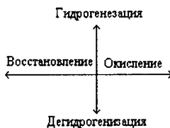
Диаграмма атомных отношений Н:С и О:С

участвовали различные удобрения. В одну группу можно объединить ПОВ контрольного и фонового вариантов, соломы и торфа, сидерат и навоз. Самостоятельное положение занимает ПОВ, образование которого связано с вермикомпостом. Однако и эти группы неоднородны с точки зрения процессов, которые могут принимать участие в образовании ПОВ того или иного качественного состава.