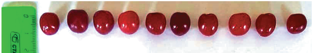
Рис. 2. Плоды вишни войлочной

По данным Н.Н. Коваленко, в среднем по виду диаметр плодов колеблется от 1 до 1,5 см, масса составляет 1,5–2,5 г. Биохимические показатели плодов имеют широкое варьирование в зависимости от формы. Суммарный процент сахара в плодах находится в пределах 7,2–13,8 [3]. В проведенных нами исследованиях длина и диаметр плода варьируется в пределах 1,1–1,2 см (рис. 2), масса плода – 0,9 г, количество сахаров в плодах в среднем составляет 10°Вх. При этом изменчивость плодов не превышает 6%, что говорит об их однородности.