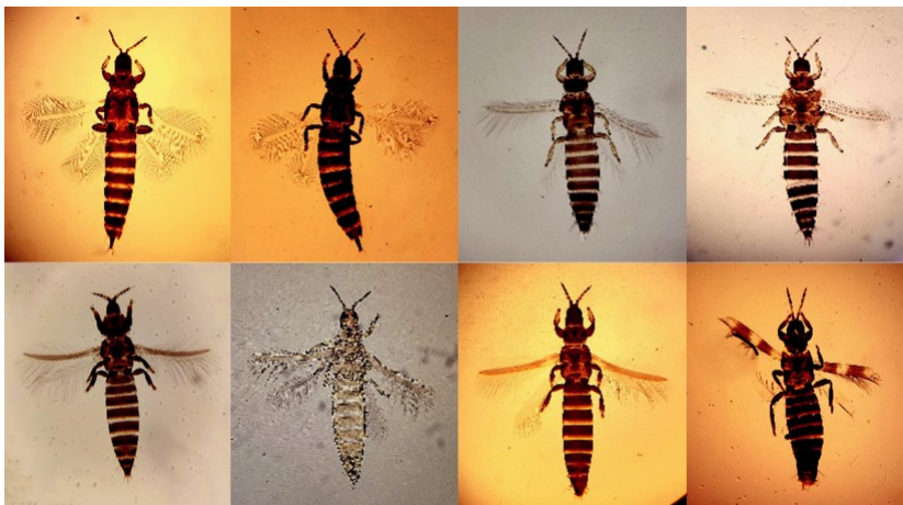
Рис. 1. Виды трипсов: (1) Haplothrips aculeatus ; (2) Haplothrips tritici ; (3) Frankliniella tenuicornis ; (4) Frankliniella intonsa ; (5) Chirothrips manicatus ; (6) Anaphothrips obscurus ; (7) Limothrips denticornis ; (8) Aeolothrips intermedius

Наиболее часто встречающиеся виды трипсов: пустоцветный трипс Haplothrips aculeatus и пшеничный трипс Haplothrips tritici – составили 51.8% всех собранных экземпляров. Частое и многочисленное присутствие тонкоусого трипса Frankliniella tenuicornis подтвердило роль яровой пшеницы в качестве основного растения хозяина. Остальные виды встречались лишь в среднем и малом количестве (табл. 1)