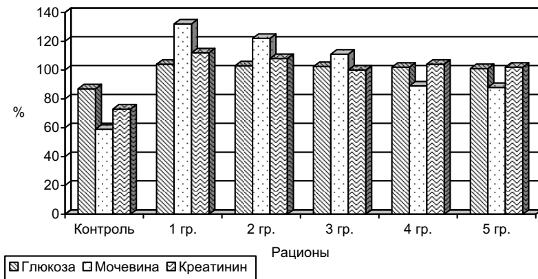
Рис. 3. Содержание глюкозы, мочевины и креатинина в крови цыплят-бройлеров в зависимости от состава рациона кормления

Как следует из рисунка 2, все пять экспериментальных кормовых рационов метаболически проявили себя достаточно активно.