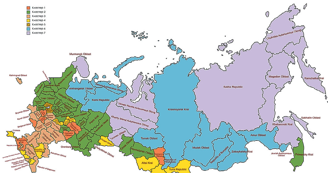
Рис. 3. Распределение субъектов Российской Федерации по кластерам

Распределение регионов в кластерах представлено на карте (рис. 3) и в таблице 2.