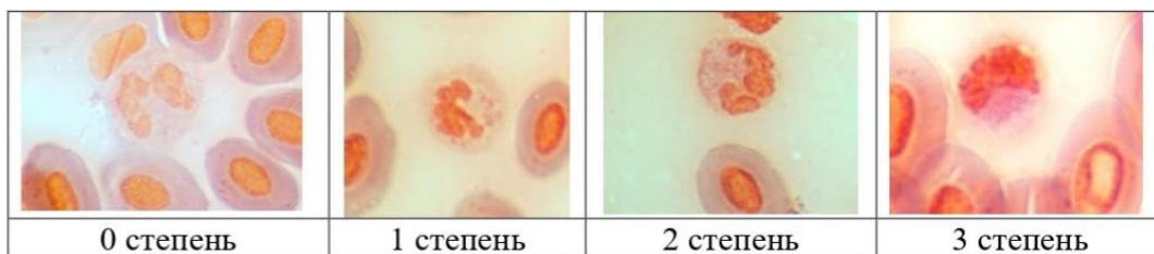
Рис. 4. Степень активности нейтрофилов арктического гольца

К концу опыта масса тела в контроле составила 2,8 кг при длине тела 46,7 см, в подопытной группе – 2,9 кг при длине тела 49,6 см. Все морфометрические показатели контрольной и экспериментальной групп арктического гольца находились в пределах физиологической нормы для рыб [7, 8] (табл. 1).