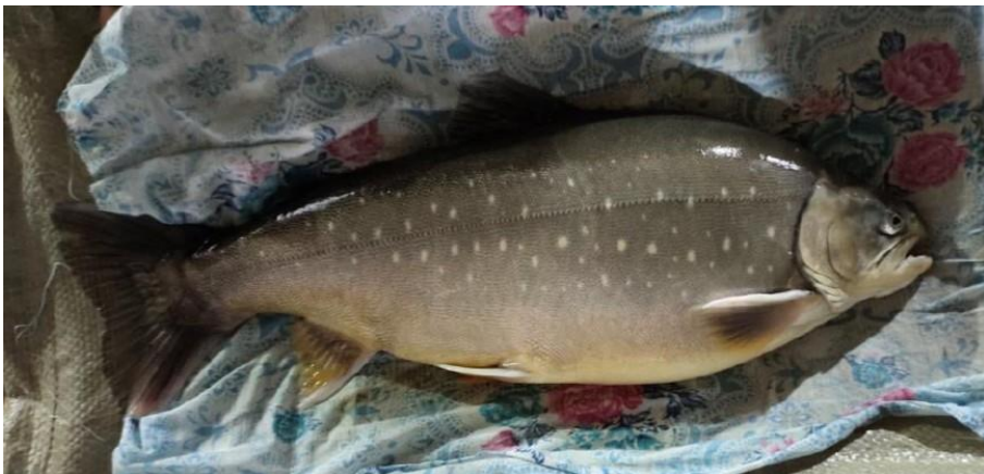
Рис. 1. Арктический голец в 3-летнем возрасте

Пробы отбирались у 7 особей контрольной и 7 особей опытной групп гольца, случайная выборка. Для исследования эритролейкограммы на обезжиренное предметное стекло наносили мазки крови, далее фиксировали в 96%-ном этаноле в течение 30 мин и окрашивали по Паппенгейму. Микроскопическое исследование мазков проводили на цифровом микроскопе Биолаб ЛЮМ 11, Россия [10] (рис. 3). Эритро- и лейкоцитарную формулу определяли методом дифференциального подсчета в окрашенных мазках периферической крови.