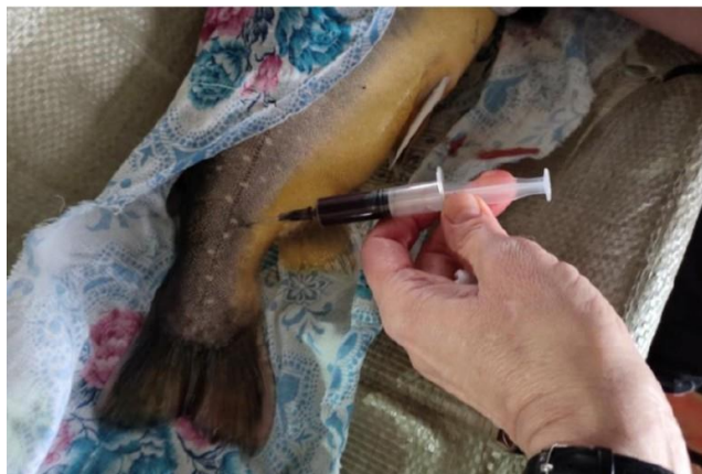
Рис. 2. Прижизненный отбор крови у арктического гольца