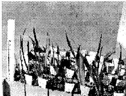
Рис. 3. Всходы тюльпанов в возрасте 4 мес из луковничек, полученных in vitro .

Дальнейшее выращивание этих луковничек в открытом грунте не представляло больших трудностей и проводилось по общепринятой для тюльпанов технологии. Дружность всходов и хорошее развитие растений позволили сделать предварительную оценку полученных гибридов по отдельным признакам (рис. 3). Разработка показателей для ранней диагностики перспективных форм пока не завершена. Положительное решение этого вопроса позволит вести отбор элит уже в первые 2 года роста гибридных сеян-