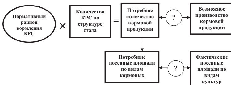
Рис. 2. Модель достижения объективности результатов мониторинга подотрасли «Животноводство»

корзины делают результаты мониторинга более понятными и важными для непосредственных потребителей сельскохозяйственной продукции.