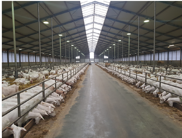
Рис. 2. Общий вид крупной промышленной фермы в Голландии

Для автоматизации производственных процессов все шире используется роботизированная техника в виде роботов-кормораздатчиков, кормовых станций, пилонов-кормораздатчиков и других агрегатов (рис. 3).