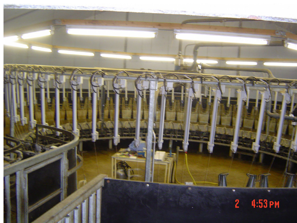
Рис. 4. Доильный зал типа «карусель» на промышленной ферме в Голландии