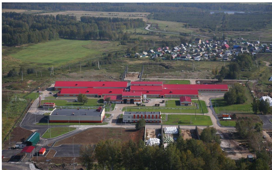
Рис. 8. Промышленная ферма компании «УГМК-Агро»

Другой ведущий производитель козьего молока – ООО «Лукоз» Республики Марий Эл – постоянно наращивает поголовье животных и строит новые фермы. С 2018 года компания при участии Ассоциации промышленного козоводства развивает проект по кооперации козоводческих ферм в Республике Башкортостан с целью создания единой системы переработки и реализации продуктов из козьего молока.