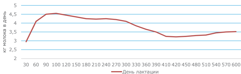
Рис. 6. Суточный удой молочных коз с пролонгированной лактацией

Широкое распространение за рубежом получил технологический прием увеличения сроков лактации. В результате генетического отбора, а также с применением интенсивных методов содержания и кормления у большинства молочных коз в Нидерландах отмечается пролонгированная лактация (рис. 6).