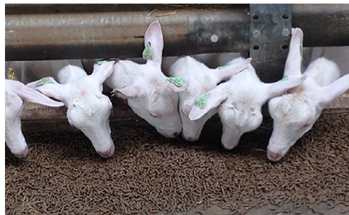
а) полнорационная кормосмесь на кормовом столе