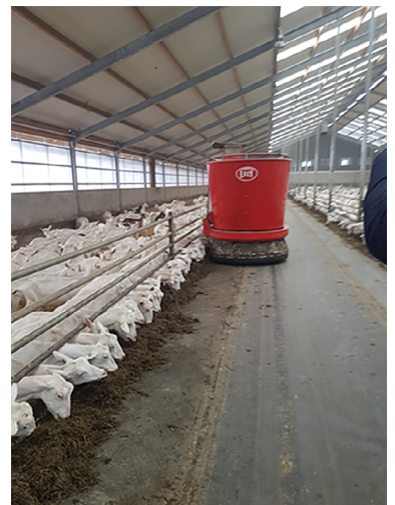
Рис. 3. Робот-кормораздатчик на промышленной ферме

Промышленные технологии содержания позволили интенсифицировать процесс кормления животных. Основой при кормлении молочных коз являются полнорационные кормосмеси или гранулированные корма (рис. 5).