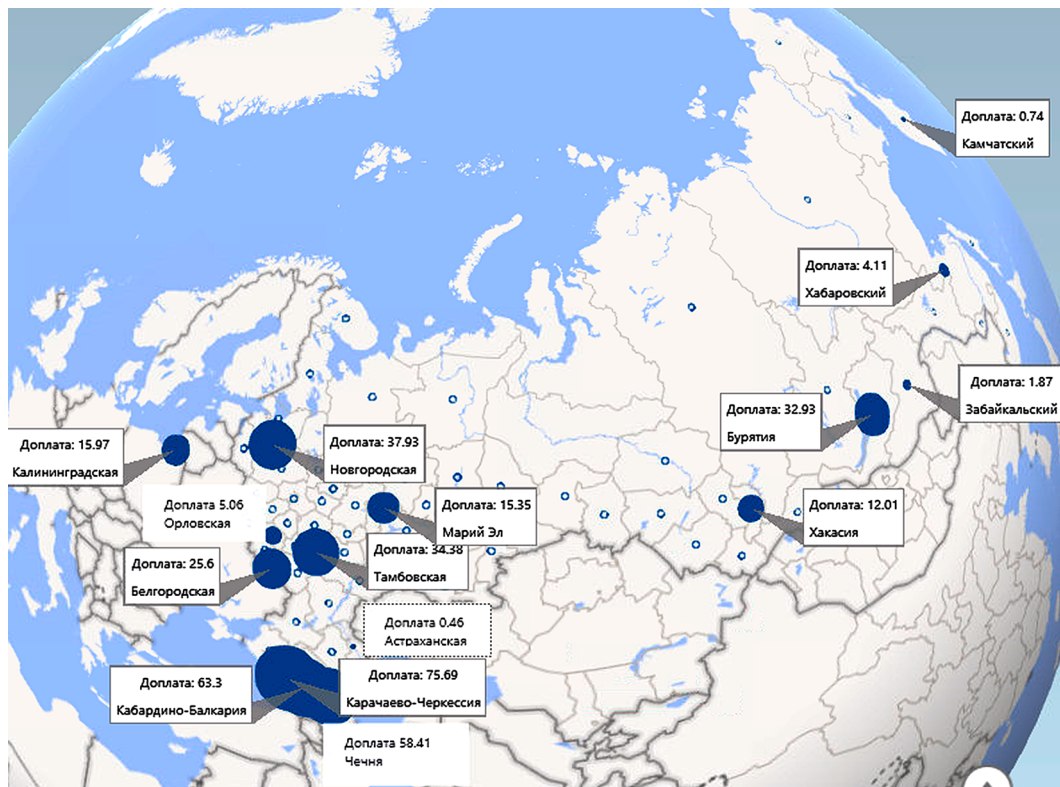
Рис. 1. Резервы повышения оплаты труда в сельском хозяйстве в субъектах Российской Федерации в сценарии потепления, тыс. руб/мес.

для 15 регионов отражены на картограмме, а оставшиеся два – это Ингушетия (9,0 тыс. руб/мес.) и Адыгея (4,15 тыс. руб/мес.). Тройка лидеров по размерам резервов осталась прежней, а четвертую позицию заняла Новгородская область, сменив на этой позиции Республику Марий Эл.