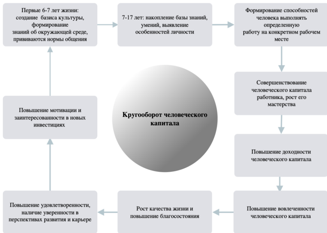
Рис. 1. Стадии функционального кругооборота человеческого капитала

Инвестирование в человеческий капитал является одной из ключевых стадий его кругооборота и включает в себя вложения как в знания и навыки человека, так и в качество его жизни в сфере сельскохозяйственного производства (рис. 1).