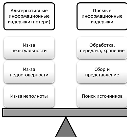
Рис. 1. Структура информационных издержек

На рисунке 1 представлена структура информационных издержек. Левая сторона баланса соответствует их трактовке [7], правая раскрывает структуру прямых информационных издержек. В частности, затраты на поиск источников информации (data acquisition costs) обычно упоминаются как составляющая часть транзакционных издержек [15, 17]. Затраты на обработку, передачу, хранение информации можно иначе назвать информационно-технологическими издержками . Эта составляющая изучена лучше других. Она распределяется между внутрифирменными транзакционными издержками, внешними транзакционными издержками и производственными издержками в пропорциях, обусловленных спецификой бизнеса. Слабее всего изучены затраты на сбор и представление информации. Под представлением данных понимается придание им формы, необходимой для их целевого использования. Примерами представления данных могут служить отчет о НИР, оформленный в соответствии с ГОСТ 7.32–2017, заполненный избирательный бюллетень, заполненные в соответствии с инструкциями формы налоговой отчетности организации, выгрузка информации из базы данных в формате XML в соответствии с заданной XML-схемой. Характерный уровень затрат на сбор и представление данных отражает смета переписи населения [13]. В зависимости от особенностей объекта наблюдения или измерения размер таких затрат в расчете на единицу данных может существенно отличаться от уровня, характерного для переписей населения, как в меньшую, так и в большую сторону.