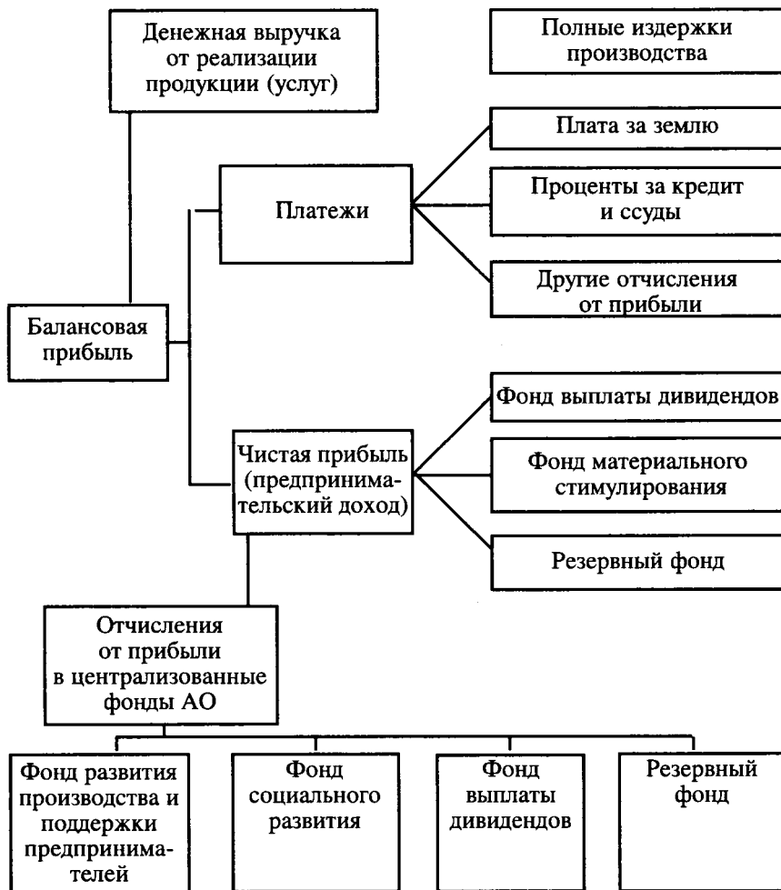
Схема 2. Формирование и использование прибыли подразделений АО

Размер и порядок взимания процентов за пользование централизованными фондами АО устанавливаются общим собранием и отражаются в договорах аренды каждого подразделения.