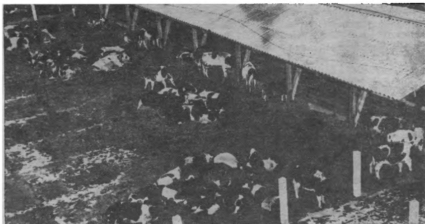
Рис. 1. На пастбище и на выгуле четко выделяются дружественные сообщества животных и коровы-одиночки.

ров — изгоев, к которым остальные животные относятся агрессивно. Так, в группе новотельных коров ОПХ «Боровское», состоящей из 120 гол., в конкурентных ситуациях (в борьбе за участок у кормушки, место отдыха, при установлении очередности входа на доильную установку) четко определялись в разное время 3 постоянные когезиальные группировки животных. В отдельные периоды спонтанно образовывалось непрочное социальное сообщество из вновь поступающих коров родильного