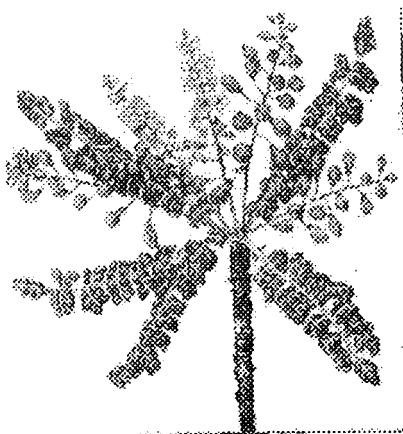
Рис. 1. Соцветие Boswellia sacra .

Соцветие — простая рыхлая кисть, расположенная в пазухах листьев на концах ветвей. Длина кистей — 9—12 см, цветоножки — 2—8 мм (рис. 1).