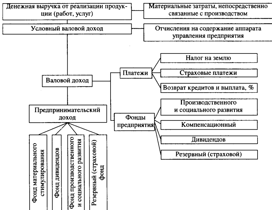
Рис. 2. Схема формирования и использования дохода внутрихозяйственного кооператива

Внутрихозяйственный кооператив за счет денежной выручки от реализации продукции (работ, услуг), средств, заработанных на стороне, а также других источников осуществляет формирование собственных финансовых ресурсов. Результатом хозяйственной деятельности кооператива является его предпринимательский доход, который образуется из выручки от реализации продукции за вычетом материальных затрат и отчислений предприятию на формирование централизованных фондов и расчетов с бюджетом. Эти отчисления включают затраты на содержание аппарата управления предприятия, его социально-бытовой сферы, выплату процентов и возмещение кредитов, земельный налог, выплату дивидендов на имущественные и земель-