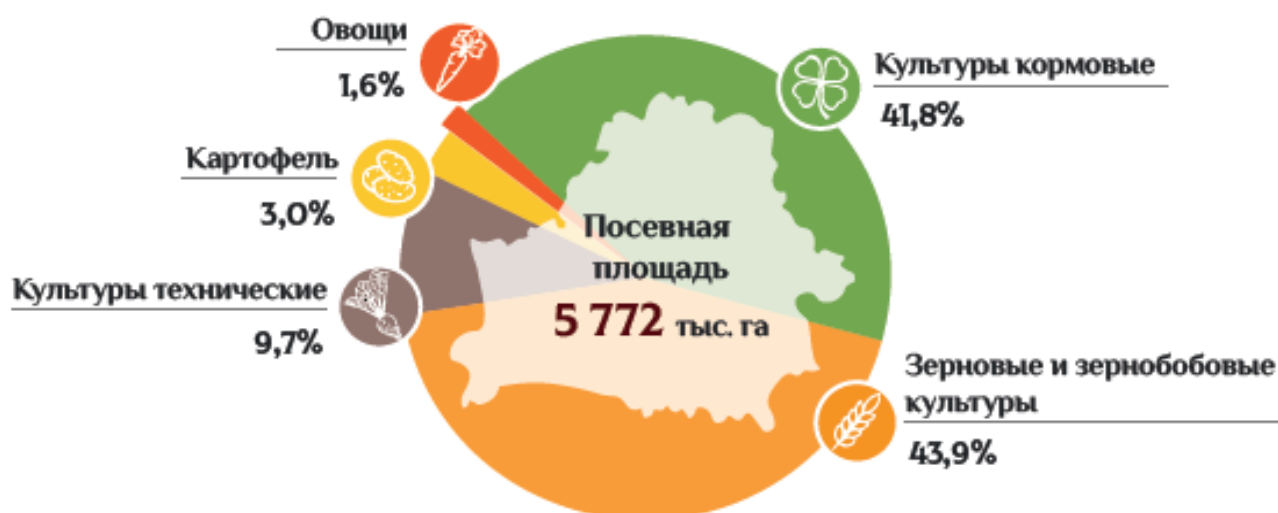
Рисунок 1 – Структура посевных площадей Республики Беларусь

сельскохозяйственного производства составляет около 7% объема валового внутреннего продукта.