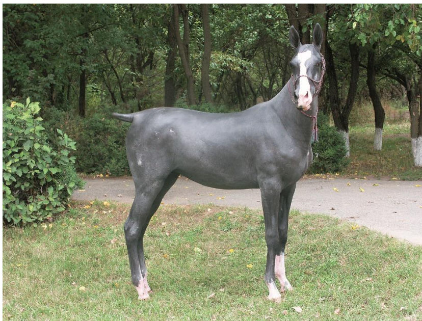
Рисунок 3 – «Ставропольский сфинкс» кобылка Малышка

Осенью 2005 года в Ставропольском конном заводе мы увидели вполне здоровую полуторалетнюю упитанную кобылку - голяка. Она также произвела неизгладимое впечатление, издали походя на огромного серого дога с розовыми ногами, отсутствие волосяного хвоста и гривы еще более усугубляло это сходство. Кобылка могла считаться вороной масти, с белыми отметинами на ногах, отливавшими розовым цветом, как и проточина на голове; на мордочке, мягкой и нежной на ощупь, были хорошо выраженные мимические морщины, вибриссы отсутствовали, а кожа корпуса была совершенно голая и гладкая. По аналогии с кошками ее назвали сфинксом, но имя дали Малышка (Рис.3).