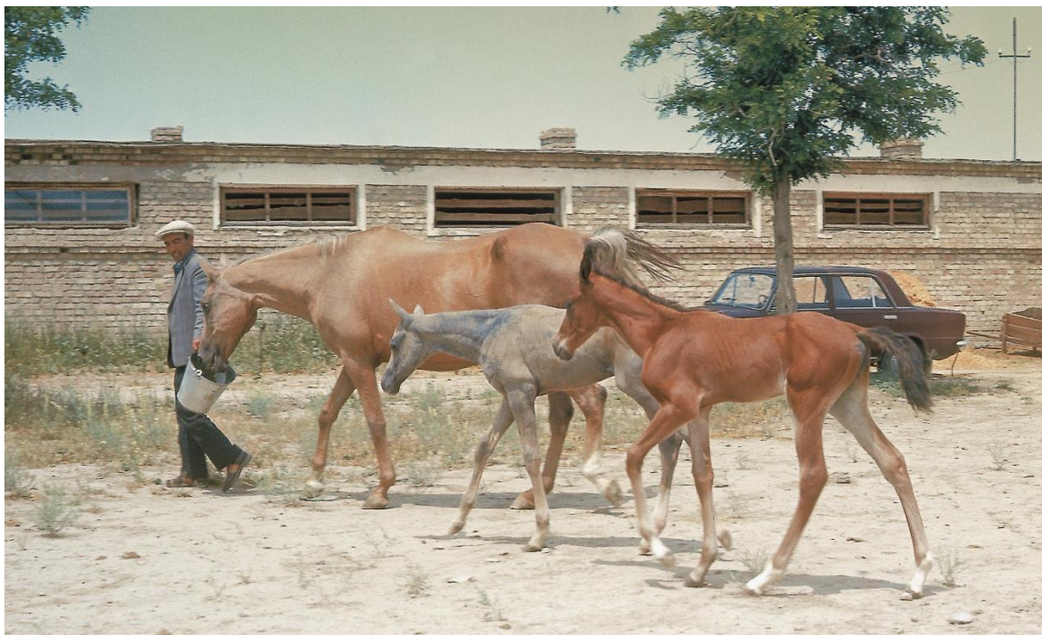
Рисунок 1 – Голый жеребенок Кимбилер (в середине) с матерью и приемным братом

Ключевые слова: ахалтекинская порода, голяк, сфинкс, наследственность, инбридинг, жеребец, кобыла, жеребенок.