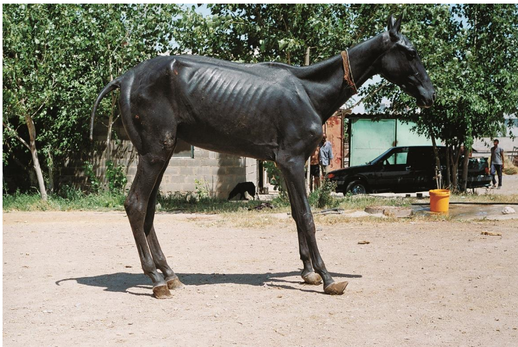
Рисунок 4 – Кобылка Ингозель незадолго до гибели

другая, названная Ингозель (Рис.4), дожила до двух лет и умерла при схожих симптомах, что и у Малышки [3].