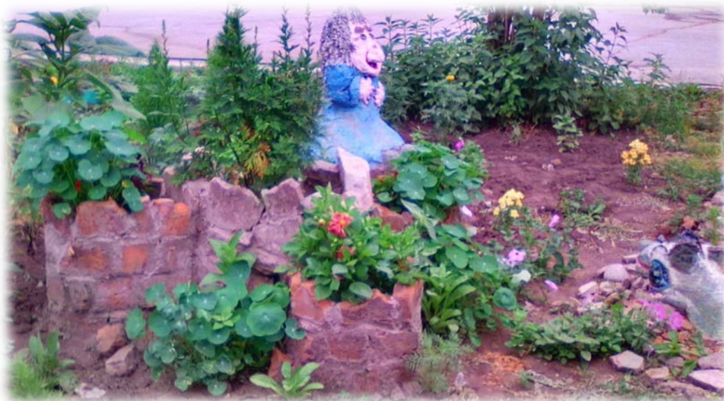
Рис. 3. Результат работы над проектом «Мифы Средневековья»

Цветочный ассортимент проекта «Мифы Средневековья» к завершению проекта несколько изменился. В начале июня наблюдались возвратные заморозки, было понижение температуры воздуха до -2^{\circ}\text{C} . Поэтому большая часть рассады замерзла, ее заменили на однолетнюю георгина и настурцию. Результаты выполнения проекта представлены на рис. 3.