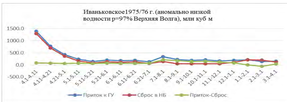
Рисунок 2 – Приток и сброс к Иваньковскому г/у 1975-76 водохозяйственный год

Исходя из вышеизложенного становится очевидным, что рассматриваемые водохранилища прежде всего осуществляют сезонное регулирование реки Волги и реки Кама в исследуемом створе гидроузлов.