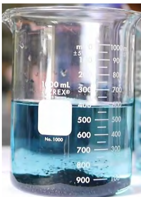
Рисунок 2 – Исходный образец с добавленным порошкообразным активированным углем

Известно, что уголь широко применяют в системах водоподготовки, поскольку он является естественным сорбентом и может задерживать вредные вещества делая воду пригодной для питья. Помимо этого, уголь способен улучшать вкусовые качества воды, а также может влиять на ее цветность [1,2].