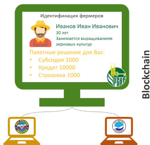
Рис. 1. Смарт-контракты