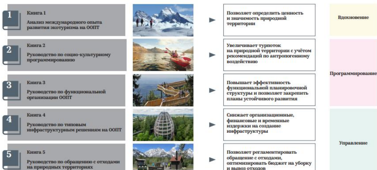
Рис.3. Туристическая модель природных территорий

Далее представлена туристическая модель природных территорий состоящая из 5 блоков (рис.3). Рассмотрим поподробнее основной блок модели: Международный опыт развития экотуризма в ООПТ. С помощью многокритериального анализа из списка развитых стран были отобраны те, что в максимальной степени отвечают цели исследования - выявление наилучших международных практик развития особо охраняемых природных территорий (ООПТ), которые могут быть использованы на территории России). Соответственно были отобраны: Объект Всемирного наследия ЮНЕСКО «Дикая природа Тасмании» Австралия, Национальный парк «Вуд-Баффало» Канада; Национальный морской заповедник «Озеро Верхнее» Канада; Национальный парк «Юстедальсбреэн» (Норвегия); Нью-Йоркский ботанический сад; Национальный памятник «Башня дьявола» США; Национальный заповедник «Высокотравные прерии» США; Национальный парк «Баварский лес»; Геопарк «Рокуа» Финляндия; Морской природный парк «Ируз»; Национальный парк «Меркантур» (Франция).