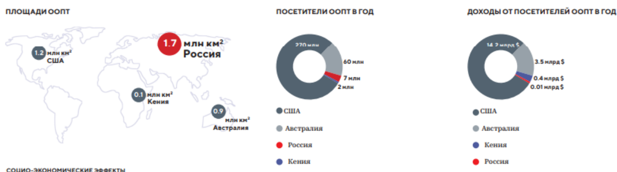
Рис.1. Мировой контекст развития экотуризма

Как мы видим, на рисунке 1 представлен сравнительный анализ стран-гигантов: США и Россия, которые имеют обширнейший потенциал для развития экотуризма и небольшая страна Кения, размером всего лишь 0.1 млн. км 2 . По показателю посетителей ООПТ лидируют США и Австралия, Россия сильно отстает по данному показателю [3]. При этом – критический анализ России и Кении по доходам от ООПТ указывает нам на то, что страна Кения при меньшем количестве посетителей (2 млн. чел) имеет доходы 0,4 млрд. $, а в России ничтожные 0, 01 млрд $. Соответственно, мы упускаем выгоду от туризма на территориях ООПТ.