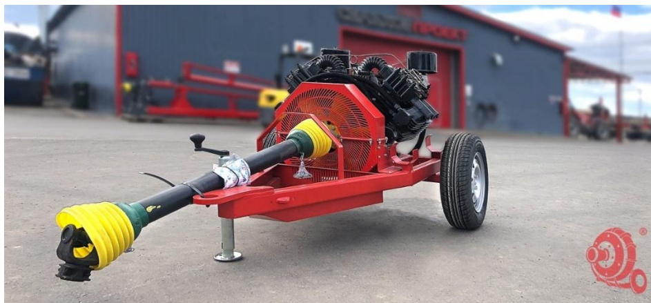
Рис.2. Компрессор для продувки шлангов

При окончании работ по внесению удобрений или смене полей обработки необходимо производить очистку магистральных и буксируемых шлангов. Для этого используется компрессор (рис. 2). Технология очистки следующая: при помощи создаваемого компрессором давления воздуха по шлангам происходит выдавливание остатков удобрений продувочным пыжом. После очистки шлангов производится смена объектов обработки или окончание работ.