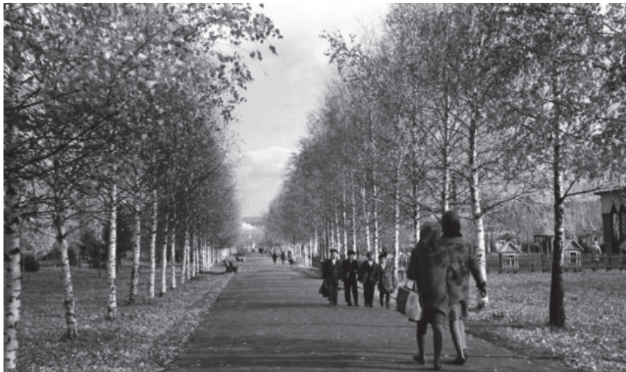
Рис. 1. Парк им. 850-летия города. Березовая аллея. 1970 г. [1]

бересклет бородавчатый ( Euonymus verrucosus ). С открытием городского парка в 1959 г. его флора пополнилась экзотическими и декоративными сортами – орех маньчжурский ( Juglans mandshurica ), бархат амурский ( Phellodendron amurense ), ель колючая ( Picea pungens ) и каштан конский ( Aesculus ).