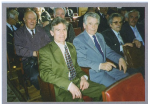
Участники конференции НАЭКОР