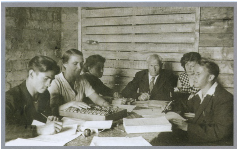
В целинном совхозе “Ждановский”, Казахстан, 1956 г.