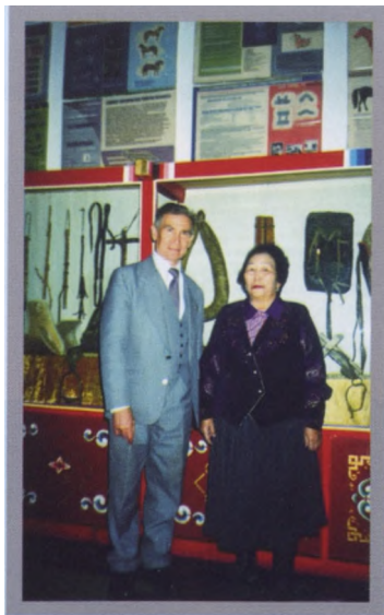
В музее конской сбруи монгольского Аграрного университета. На снимке - основатель музея