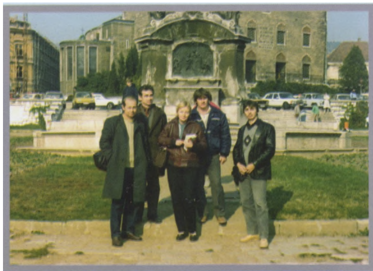
Встреча с преподавателями и студентами в Венгрии