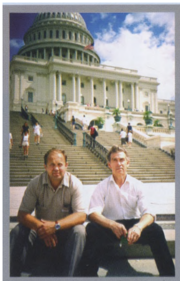
Перед Капитолием (США)