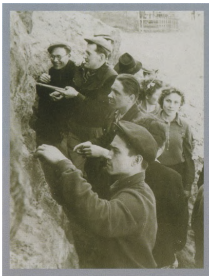
На практике по геологии