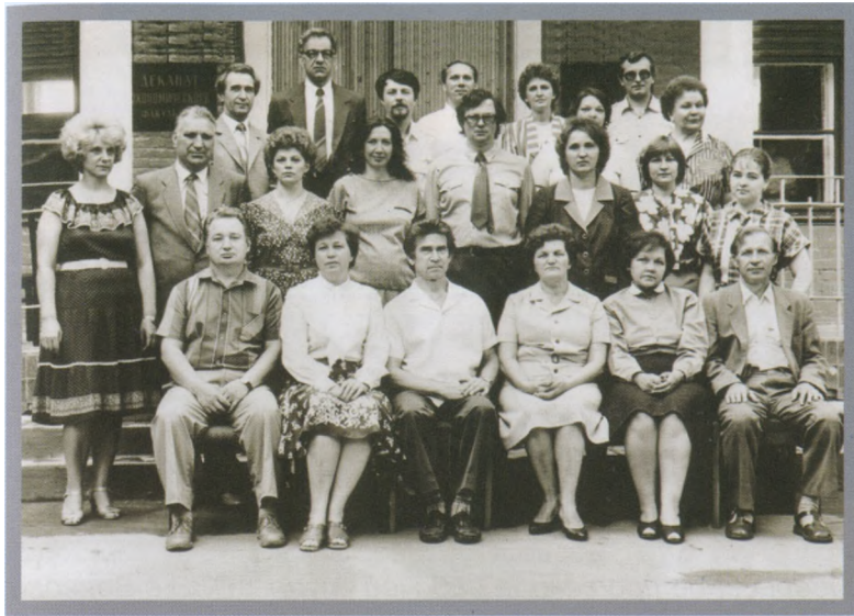
Кафедра экономической кибернетики