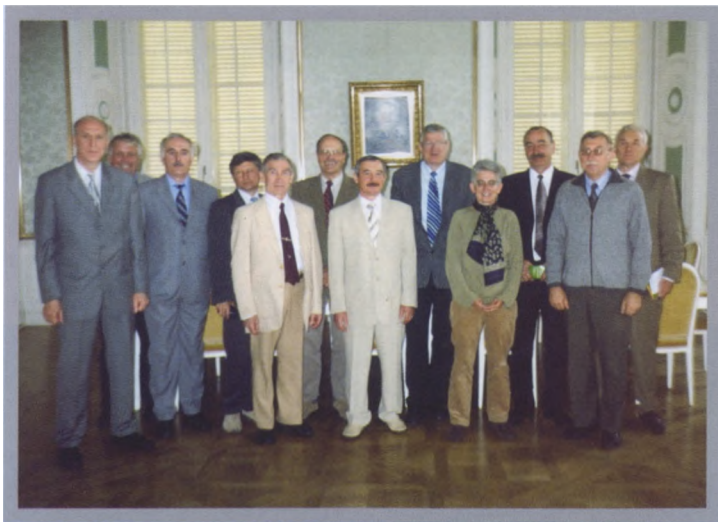
Делегация Тимирязевки в университете Hohenheim (г. Штутгарт)