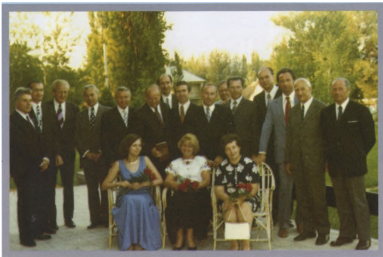
Подписание протокола рабочей группы СЭВ в Венгрии