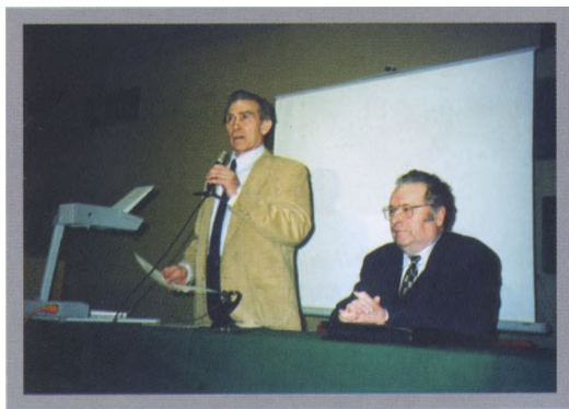
Открытие научной конференции НАЭКОР