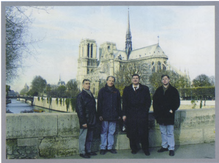
Париж. Собор Парижской Богоматери