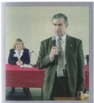
Дискуссия на конференции НАЭКОР в Алтайском ГАУ