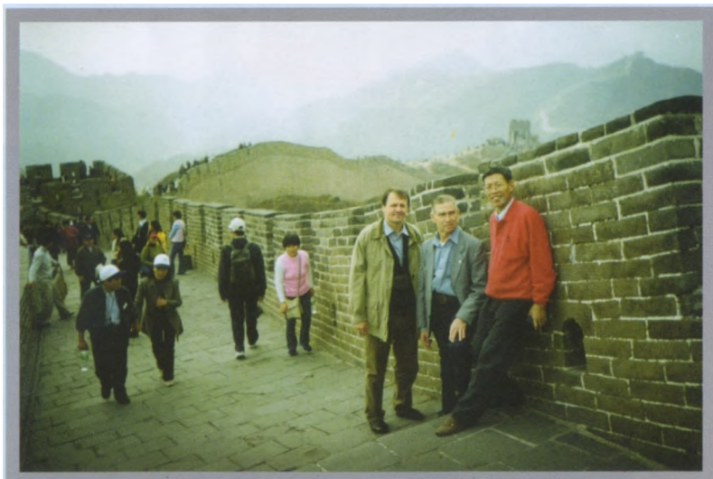
Великая Китайская стена