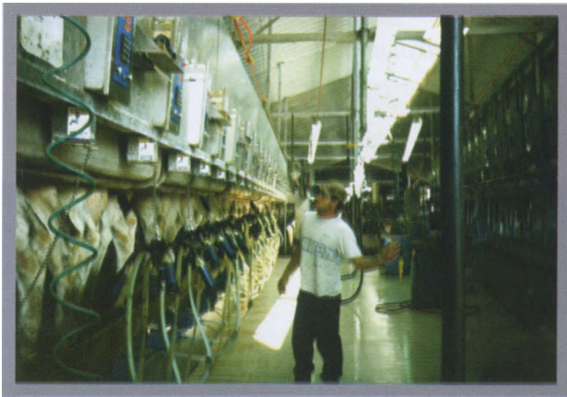
Доильный зал молочной фермы на 2000 коров (США)