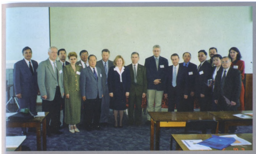
Участники конференции НАЭКОР в Алтайском ГАУ