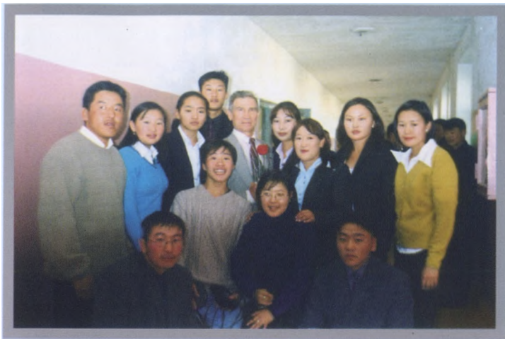
Среди студентов Аграрного университета Монголии (г. Улан-Батор)