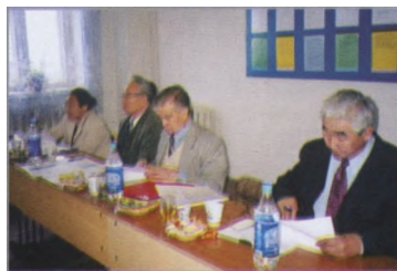
Идет защита дипломных работ в Якутской СХА