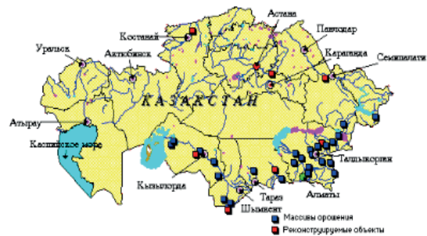
Рис. 1. Схема расположения массивов орошения республики Казахстан: ■ – массивы орошения; ■ – реконструируемые объекты

Общая площадь республики составляет 272 млн га: сельскохозяйственные угодья составляют 222 млн га, в том числе около 27 млн га пашни. Площадь орошаемых земель в Казахстане достигает 2,3 млн га, из них 1,6 млн га расположены в южных регионах республики, на которых возделывается более 30 % всей продукции растениеводства. Схема расположения массивов орошения показана на рис. 1.