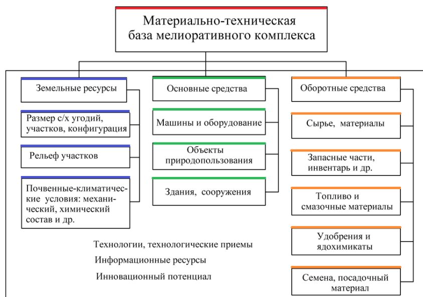
Рис. 1. Структура материально-технической базы