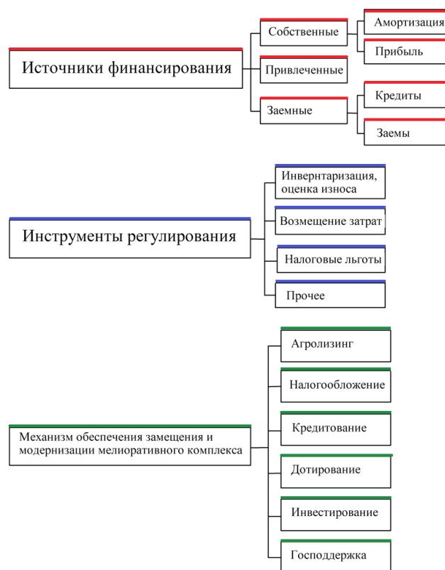
Рис. 4. Инструменты и механизмы воздействия на МТБ

Обеспечение материально-техническими ресурсами мелиоративного комплекса включает в себя определение текущей и перспективной потребности, поиск поставщиков, доставку,