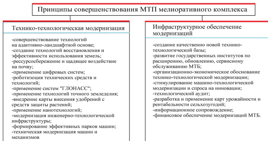
Рис. 3. Принципы совершенствования мелиоративного комплекса