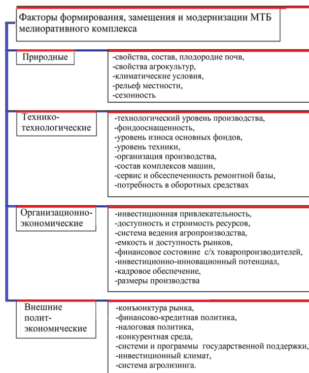
Рис. 2. Факторы влияния на материально-техническую базу