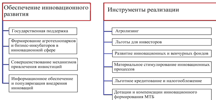
Рис. 5. Институциональные инструменты