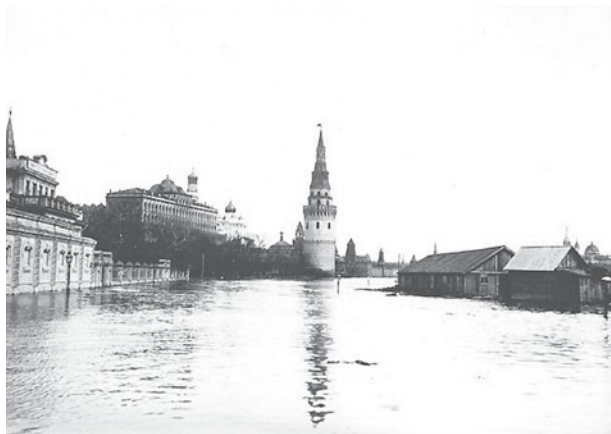
Рис. 1. Вид на Кремль с Большого Каменного моста. Наводнение 1908 года

Мосводоканал начинает борьбу с загрязнением водосборных территорий и акваторий. К весне эта работа активизируется: самосвалами вывозятся с водохранилищ сотни кубометров мусора. Очистка воды на Рублевской водопроводной станции достаточно дорогая. Секрет Рублевки – в ее перманентной модернизации, в обновлении системы автоматики и контроля за дозированием реагентов. Не так давно на станции