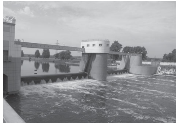
Рис. 4. Вид на Рублевский гидроузел со стороны нижнего бьефа

Плотина Рублевского гидроузла — водосливная, с поверхностным двухпролетным водосбросом и вальцовыми затворами. Ширина каждого пролета в свету 30 м, центрального бычка — 5 м. Правобережный устой плотины совмещен со зданием ГЭС, левобережный сопрягается с левым берегом вертикальными подпорными стенками. Общая длина всего напорного Рублевского гидроузла (плотины и ГЭС) составляет 85,38 м (рис. 4).