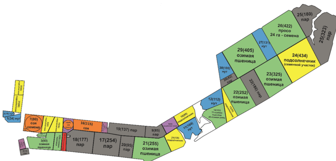
Рис. 2. Структура посева на полигоне УНПО «Поволжье» в 2023 г.

Мелиоративный полигон УНПО «Поволжье» Вавиловского университета оборудован дождевальными машинами фирмы Lindsay (США) Zimmatic кругового действия, Zimmatic фронтального действия и ДМ «Кубань-ЛК1М» (Каскад) кругового действия [12].