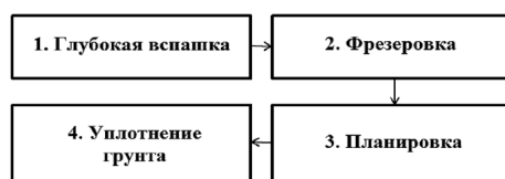
Рис. 3. Технологические операции

Технологические операции по изменению объемной плотности торфяного слоя приведены на рисунке 3.