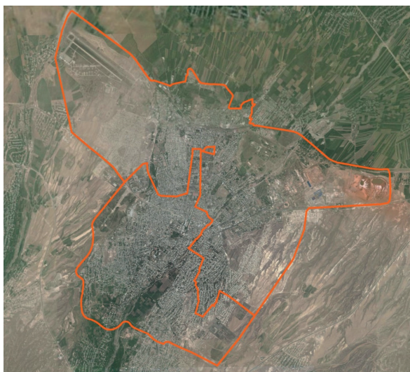
Рис. 2. Общий вид города Гянджи

На основании постановления Кабинета Министров Азербайджанской Республики от 18 апреля 1988 года в Гяндже был создан исторический заповедник. 20 ноября 1988 года приказом № 420 было подтверждено разделение этого заповедника на две части: 1482 га было отведено территории города Гянджи, 610 га было отведено Самухскому району. 2051 га территории является исторической землей, на которой выросла Гянджа [5].