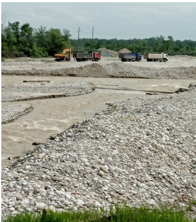
Рис. 3. Карьер по выборке песчано-гравийных материалов в русле р. Чегем

Исследуемый участок – русло р. Чегем, где ведутся карьерные работы по выборке песчано-гравийных материалов. На данном участке русла, в связи с уменьшениями уклонов, наблюдается зона отложения аллювиальных пород. Аллювий реки сложен обломочным