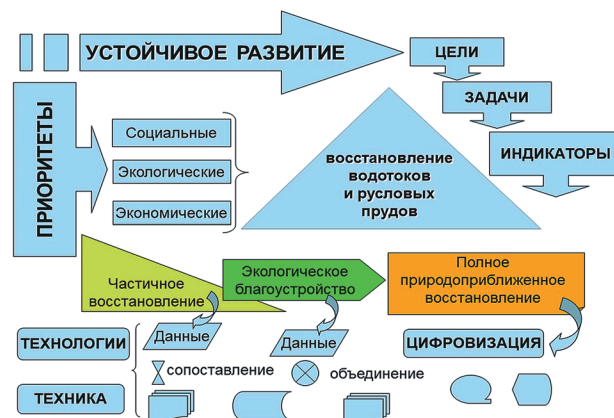
Рис. 2. Алгоритм природоподобного восстановления малых водных объектов с использованием триады «Технологии-техника-цифровизация»

ежедневно, а для прочих водоемов – один раз в два дня. Профилактическая очистка мусорозадерживающих решеток от мусора проводится с той же периодичностью. Вопрос с отходами решается следующим образом: на начальном этапе проводится их транспортировка на площадки временного накопления, последующая погрузка и передача – на утилизацию специализированным организациям [12]. Укрупненный расчет себестоимости работ представлен в таблице 2.