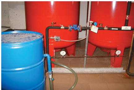
Рис. 1. Лабораторная установка для определения характеристик потока Fig. 1. Laboratory installation for determining the characteristics of the flow