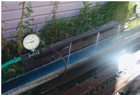
Рис. 2. Уточнения коэффициента отсоединения жидкости a_2 Fig. 2. Clarification of the coefficient of disconnection of the fluid a_2

Лабораторная установка включает в себя: 1 – напорный бак; 2 – сменные трубы с отверстиями разного диаметра и на разном расстоянии; 3 – пьезометры (больше 0,1 МПа – манометры); 4 – мерный бак; 5 – сливной бак; 6 – насос; 7 – желоб.