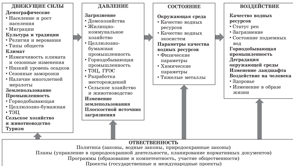
Рис. 2. Схема DPSIR -анализа

В этой связи для определения основных подходов к решению экологических проблем в бассейне реки Селенги в рамках многосторонних научно-исследовательских разработок авторами предложена интегрированная модель управления водными ресурсами в бассейне реки Селенги [3, 4]. В ее основе лежит методология DPSIR -анализа ( D – drivers – движущие силы; P – pressure – давление; S – state – состояние; I – impact – влияние или воздействие; R – response – ответственность), разработанная Европейским экологическим агентством и адаптированная к условиям трансграничного бассейна реки Селенги (рис. 2).