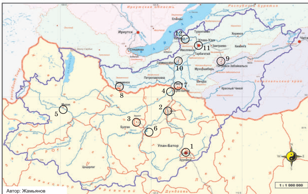
Рис. 3. Основные источники негативного воздействия на водные ресурсы в бассейне реки Селенги

5–6. Формирующиеся узкоспециализированные Муренский (по добыче фосфоритов) и Заамарский (около 40 компаний действуют по добыче золота на расстоянии 60 км вдоль реки Туул) промышленные узлы. Необходимы мероприятия по охране поверхностных вод при разработке недр и восстановлению нарушенных земель. В районе местности Заамар целесообразно