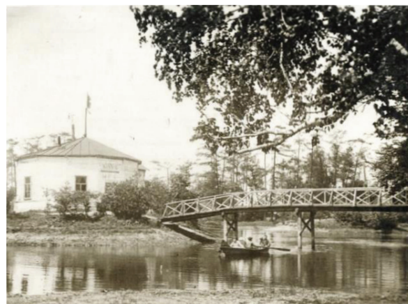
Рис. 2. Деревянная беседка на острове до реконструкции, 1920-1930-е гг., опубликована в 1936 г. [12]. Почтовая карточка, 1933-1934 гг., сад Облпрофсовета

Судя по почтовой карточке 30-х гг. XX в. (рис. 2), изначально открытая беседка была утеплена, поставлена печка, использовалась клубом для игр.