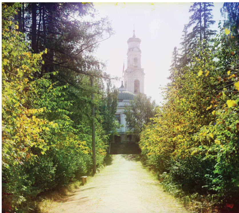
Рис. 1. Фотография С.М. Прокудина-Горского, 1910 г.: вид на Вознесенскую церковь и утраченную беседку-ротонду

С введением «сухого» закона в 1914 г. арендатор оставил неприбыльное дело. После революционных событий 1917 г. долгое время дом Харитоновых передавали из рук в руки, пока в 1936 г. усадьбу вместе с са-