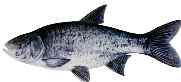
Рис. 2. Пестрый толстолобик