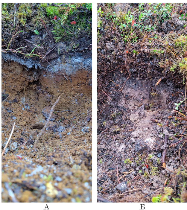
Рис. 2. Характерные типы почв на участках лесных культур сосны в условиях черничного (Б) и брусничного (А) типов леса (Лоухское лесничество Республики Карелия)