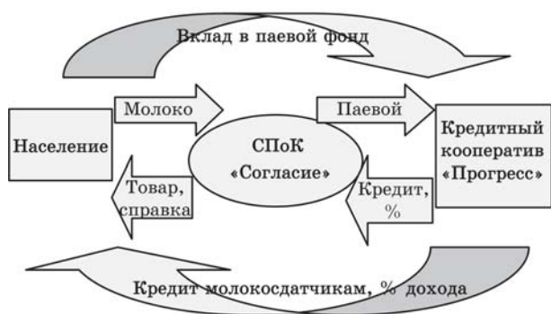
Рис. 1. Взаимодействие участников кооперативного движения

Схематично взаимодействие участников кооперативного движения в Промышленновском районе Кемеровской области можно представить следующим образом (рис. 1).