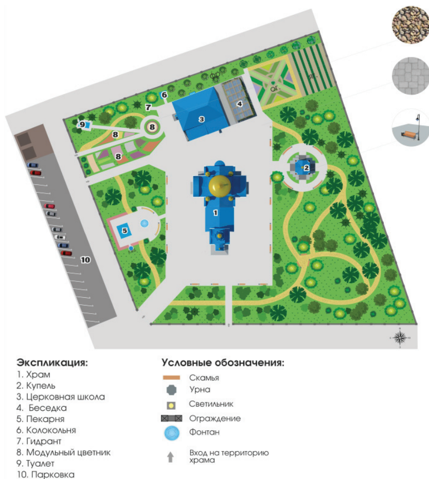
Рис. 1. План благоустройства территории храма Покрова Пресвятой Богородицы села Дивное

К выбору растений для посадки их на прихрамовой территории есть определенные требования. Важно подобрать растения-символы в образе «библейских». Желательно, чтобы было много цветов и во всей красе расцветали к большим церковным праздникам. Тогда цветы не только будут радовать прихожан вокруг храма, но их можно будет использовать для украшения интерьера [6].