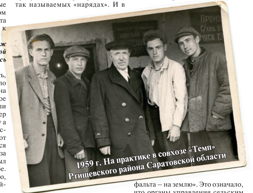
1959 г. На практике в совхозе «Темп» Ртищевского района Саратовской области

А вскоре — новая реорганизация. Теперь под девизом «с ас-