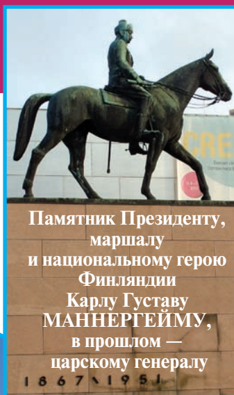
Памятник Президенту, маршалу и национальному герою Финляндии Карлу Густаву МАННЕРГЕЙМУ, в прошлом — царскому генералу 1867-1951