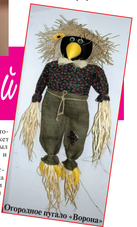
Огородное пугало «Ворона»