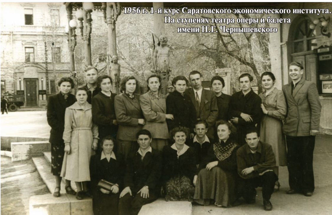
1956 г. 1-й курс Саратовского экономического института. На ступенях театра оперы и балета имени Н.Г. Чернышевского