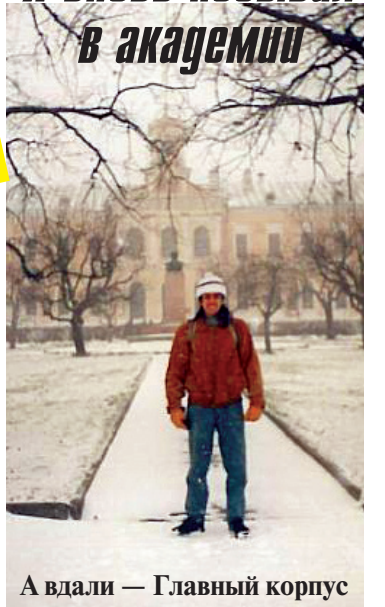
А вдали — Главный корпус