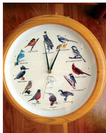
Поющие часы. Подарок американских друзей