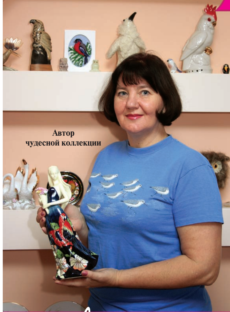
Автор чудесной коллекции