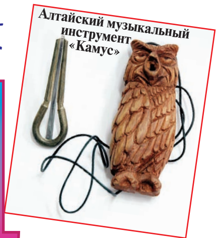
Алтайский музыкальный инструмент «Камус»