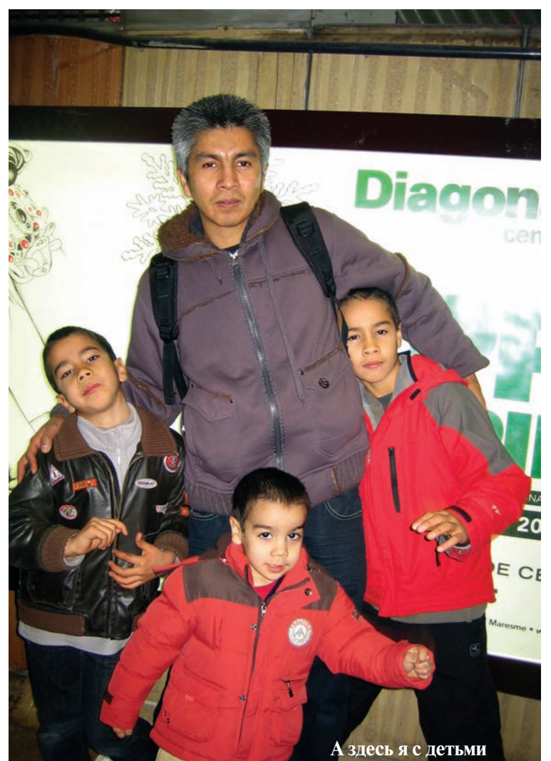
А здесь я с детьми

Перевел Кристиан Алсивар — аспирант технологического факультета