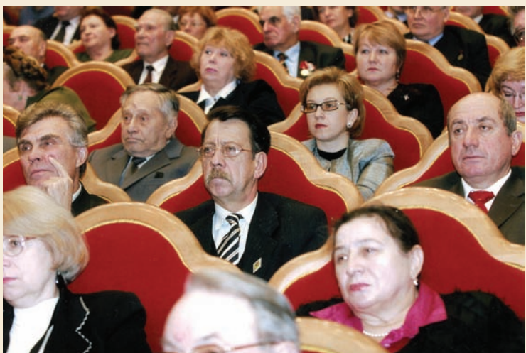
Зал Церковных Соборов Храма Христа Спасителя. Торжественный вечер, посвященный 140-летию образования Петровской земледельческой и лесной академии (ныне РГАУ — МСХА). 2005 год